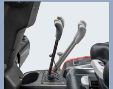
La cover si apre facilmente posizionando indietro le leve