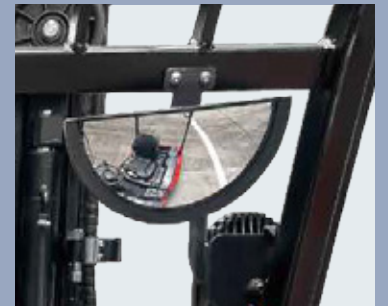
Specchietto retrovisore panoramico