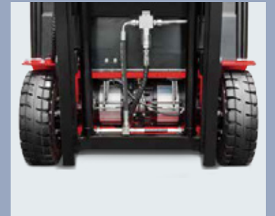
Doppio motore trazione frontale