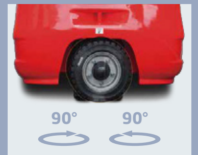
Il ridotto raggio di sterzata è perfetto per i corridoi stretti